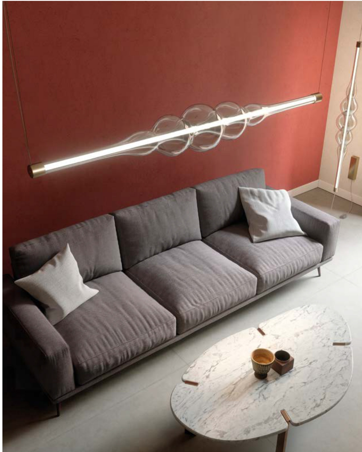
GIG1553.OR.2 Glass: transparent Structure: satin gold