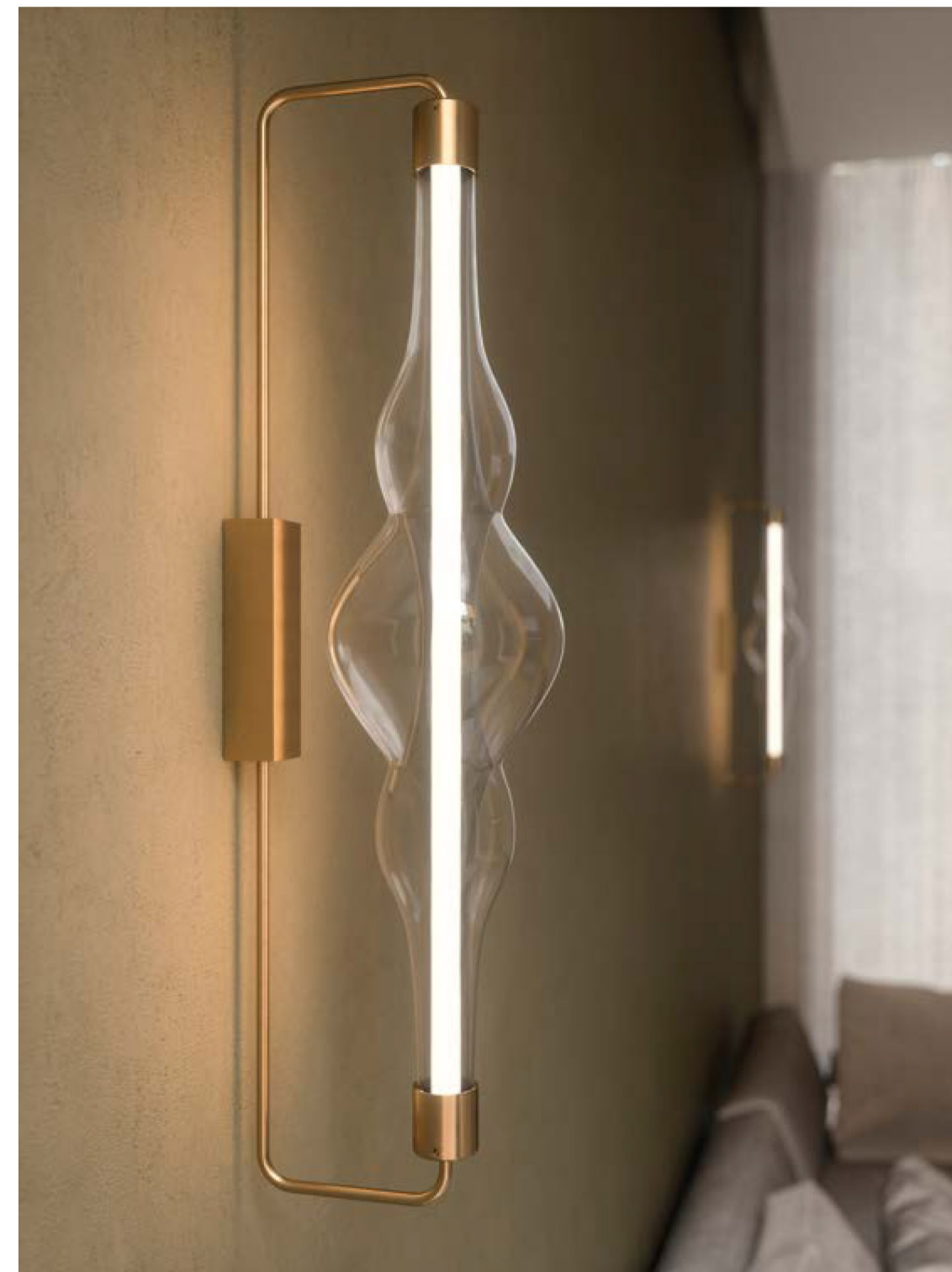
AP1551 Glass: transparent Structure: satin gold