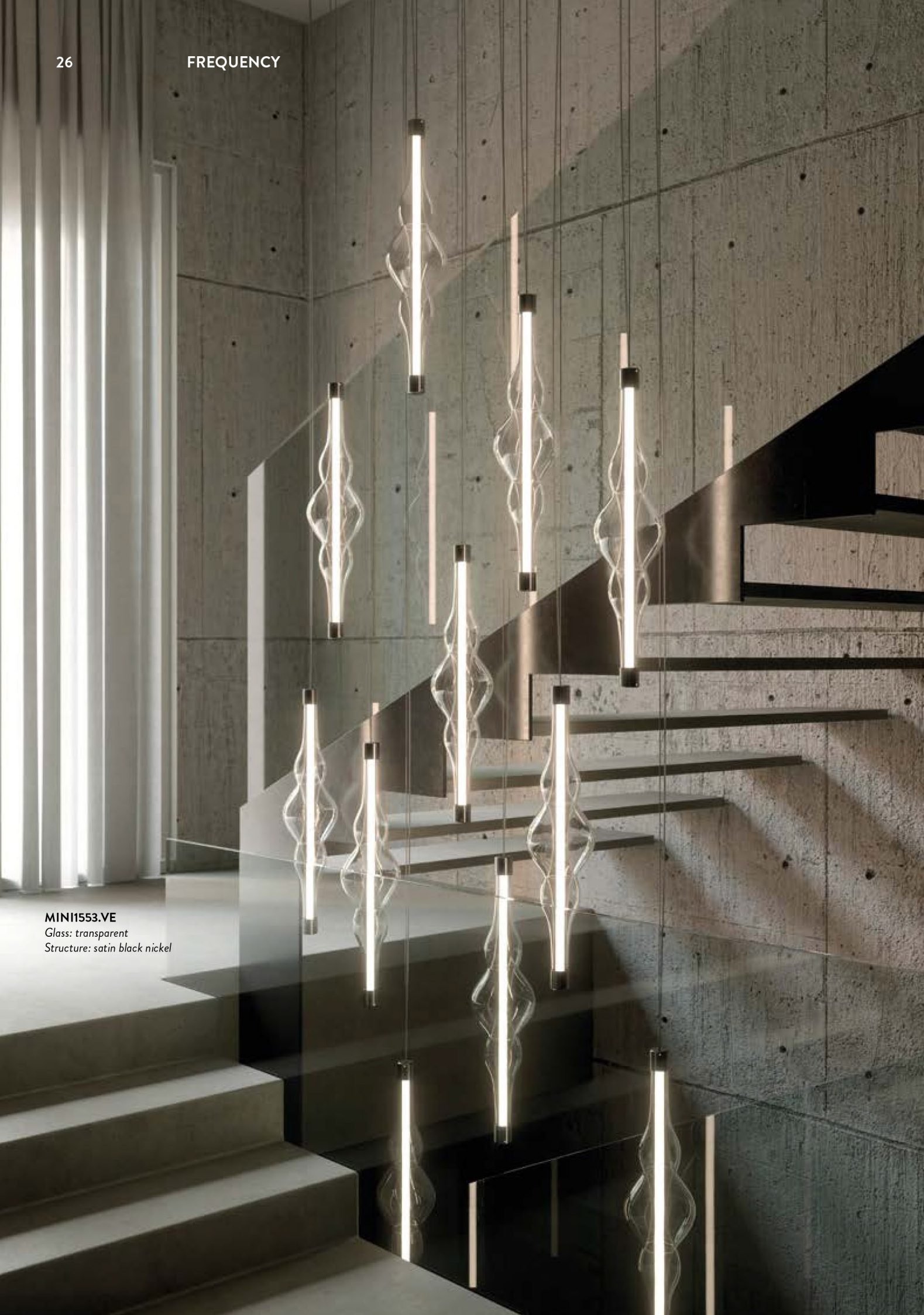
MINI1553.VE Glass: transparent Structure: satin black nickel