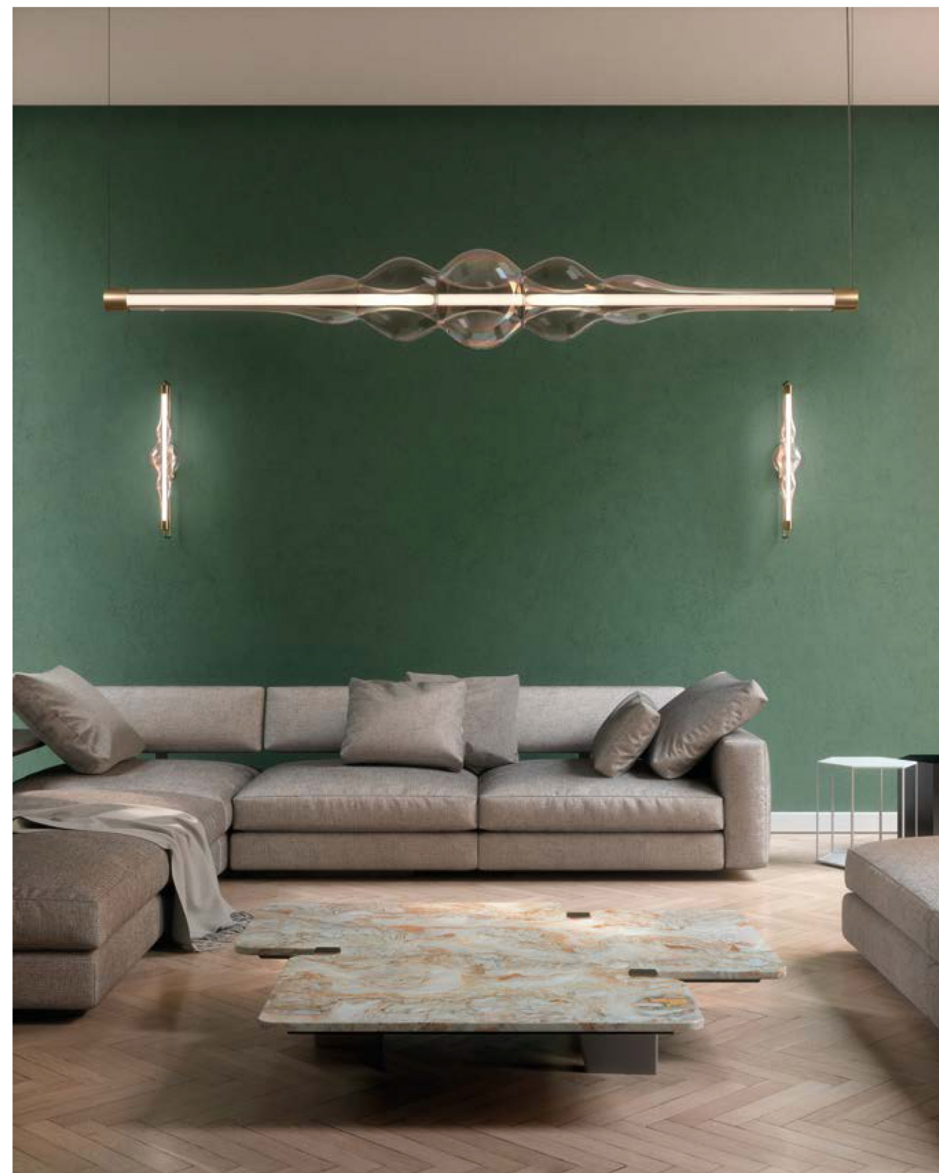
GIG1553.OR.2 Glass: bicoloured shiny-tobacco Structure: satin gold