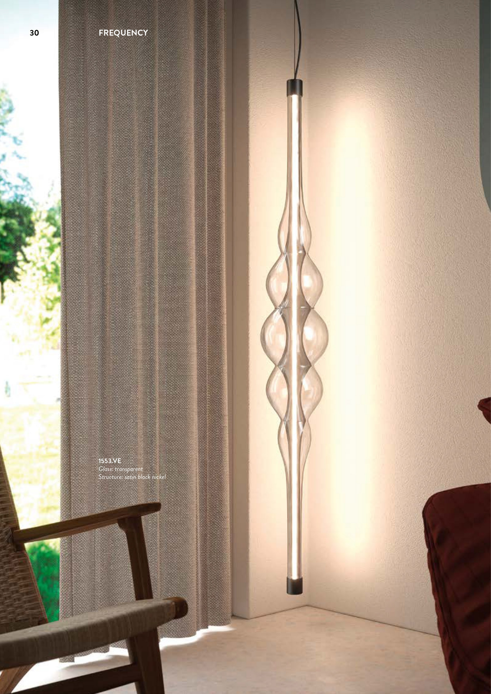
1553.VE Glass: transparent Structure: satin black nickel